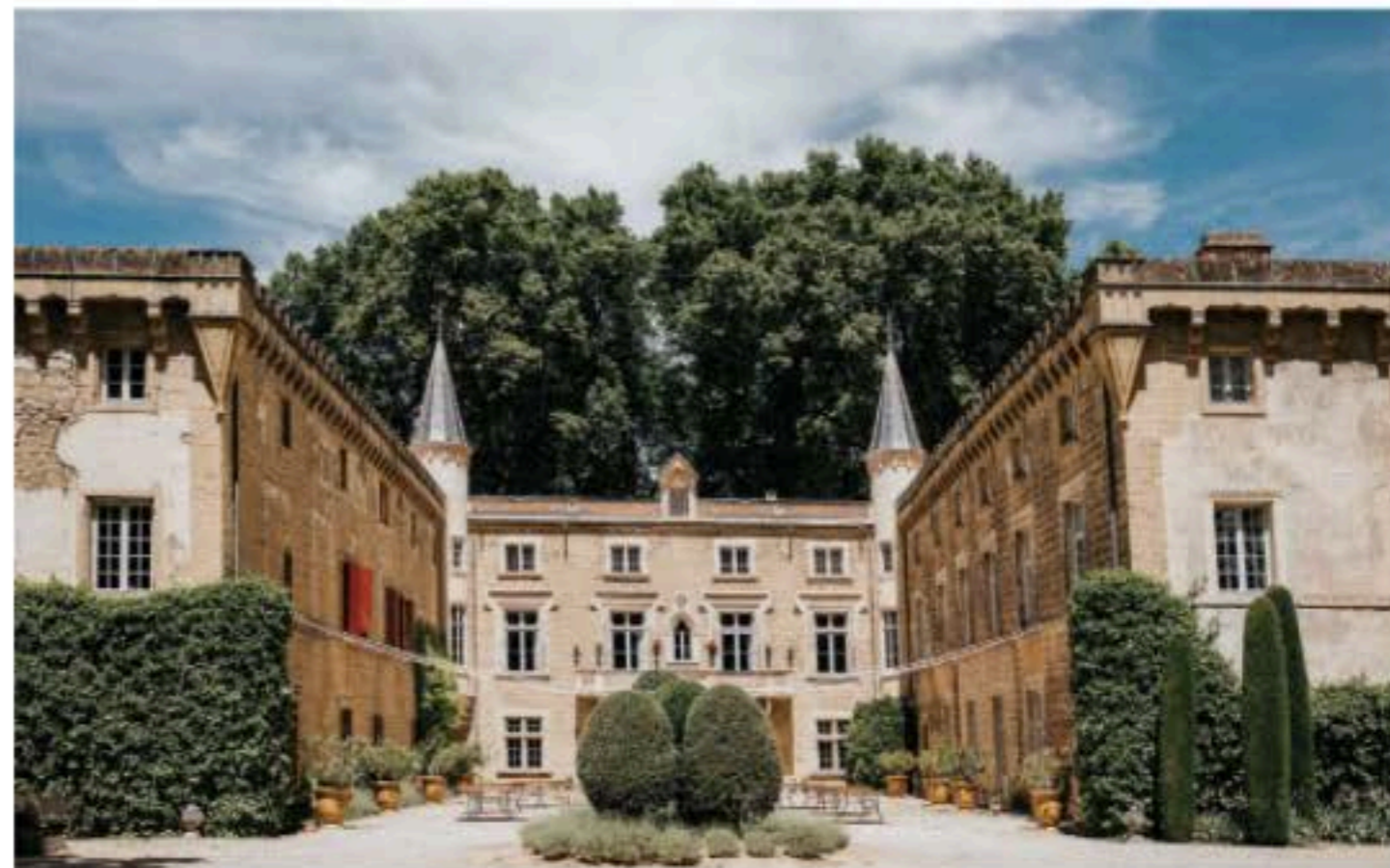
Öppna gator och stora fönster inviterar det mjuka Provence-ljuset att fylla varje rum med glädje.

»Jag letade i fem år innan jag äntligen hittade dessa på Blocket.«