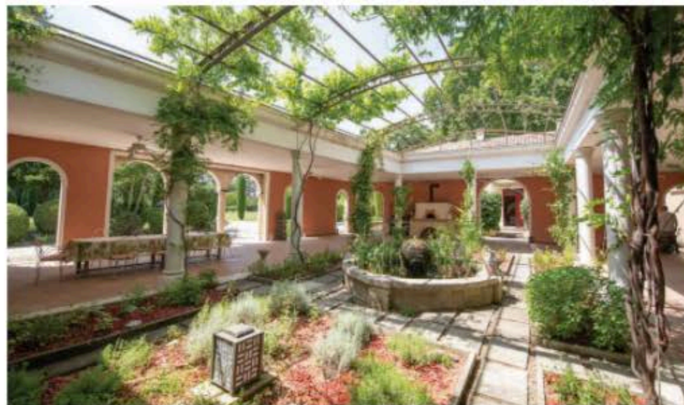
En fin bris bär örträdgårdens aromatiska doft över utemilsdelen med piazzan som har plats för 150 gäster.