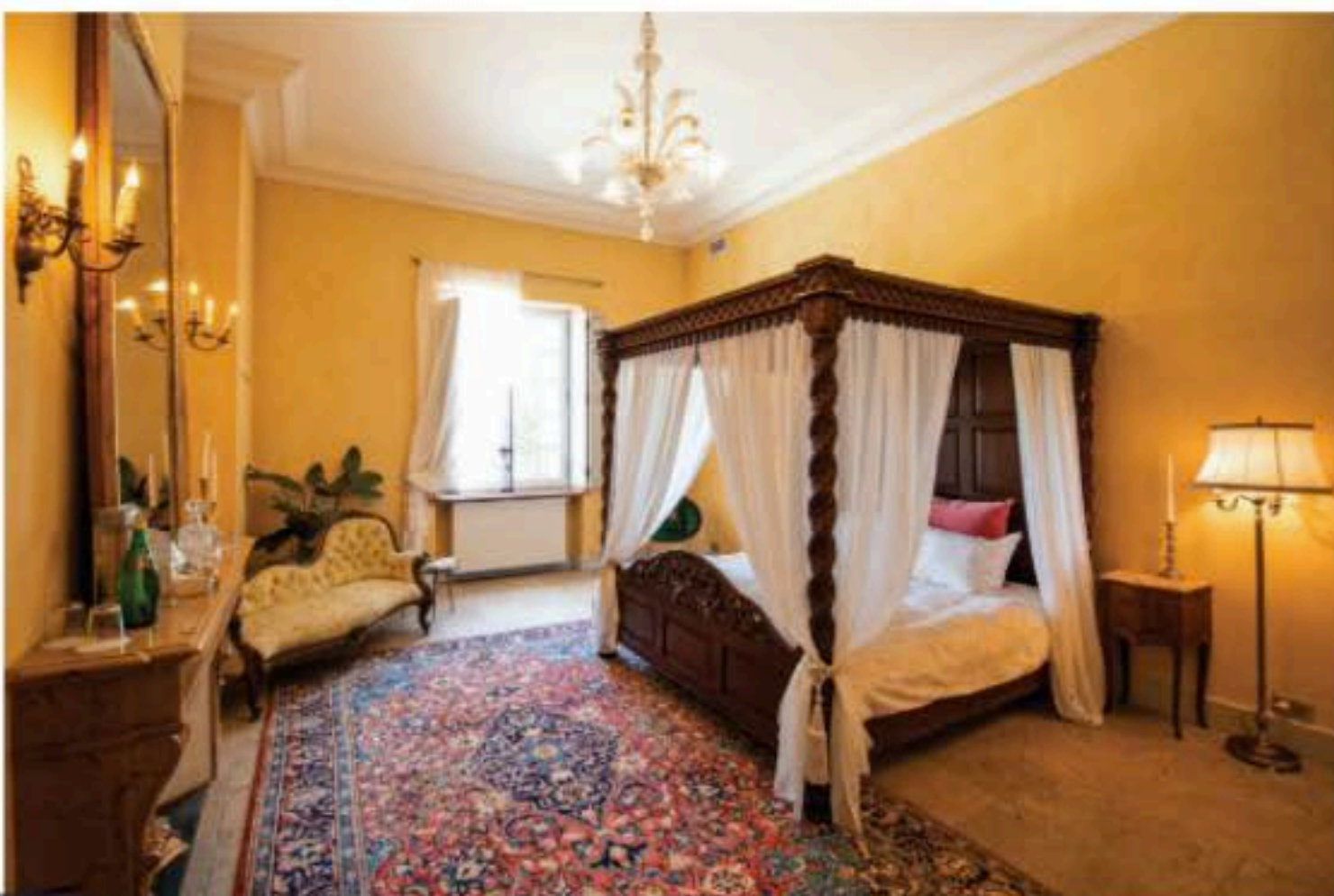
Bibliotekets intima kamrars hjulor på brett utbud av läsupplevelse och kontemplation. En Simenon, Simon eller Sartre till svoramen?