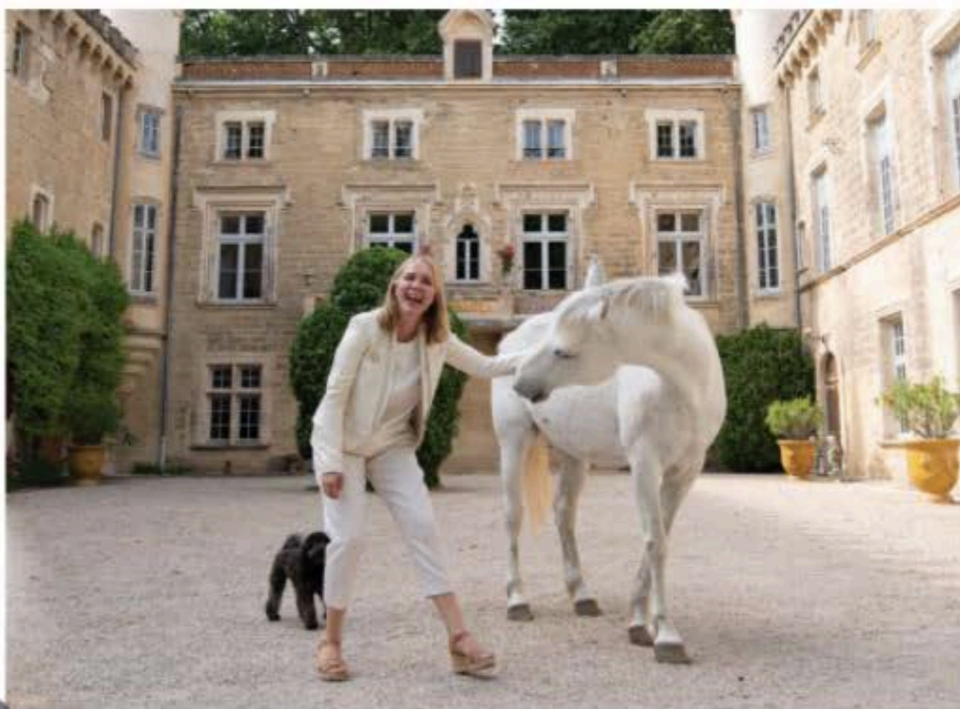
En värbild plats i hjärtat hos gästerna har familjens vita hästar som betar på egendomens ängar med Mont Ventoux i bakgrunden.