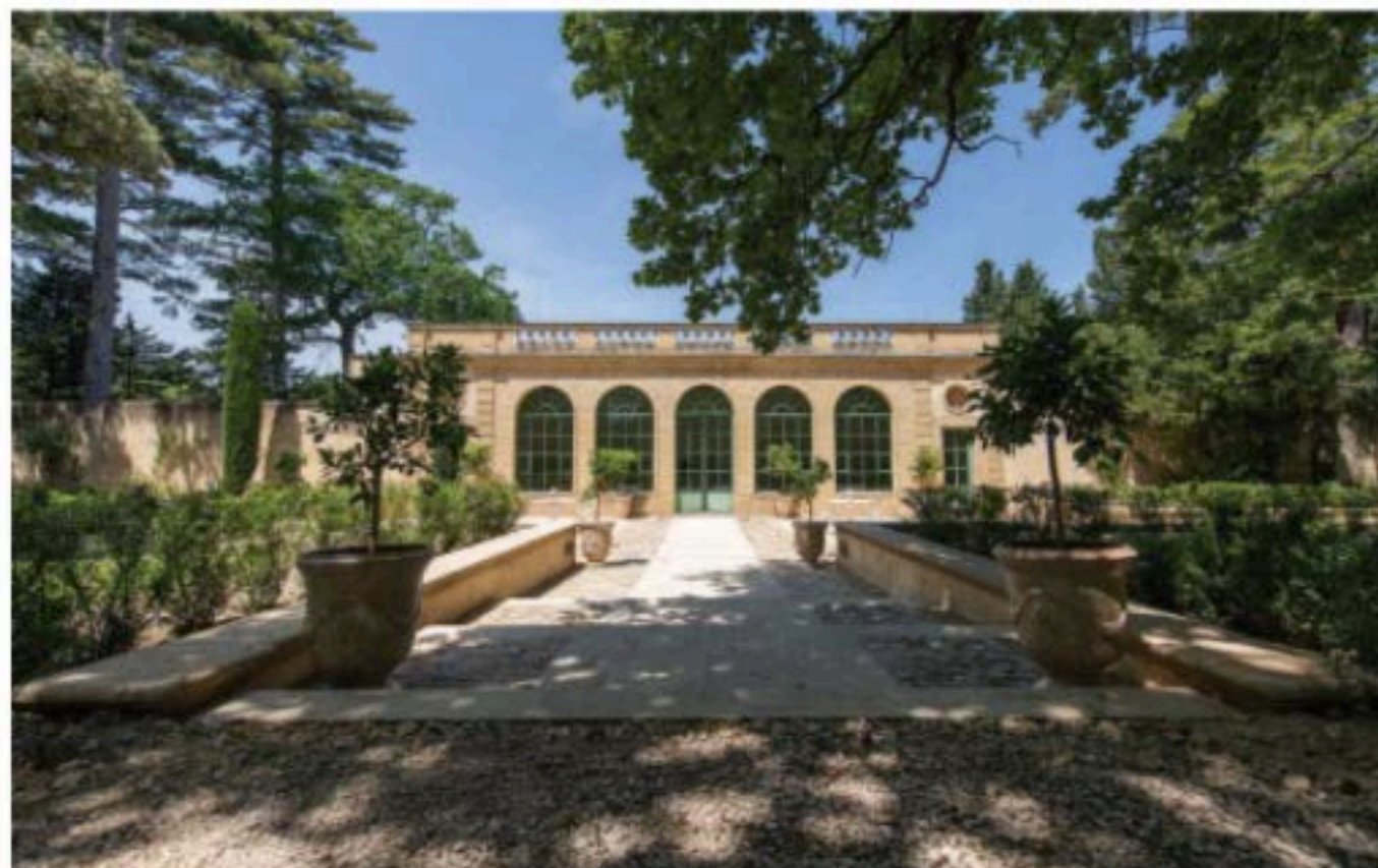
Vackert och avskilt ibland grönska ligger slottets poolområdet med omklädningsrum, lounge och kök.